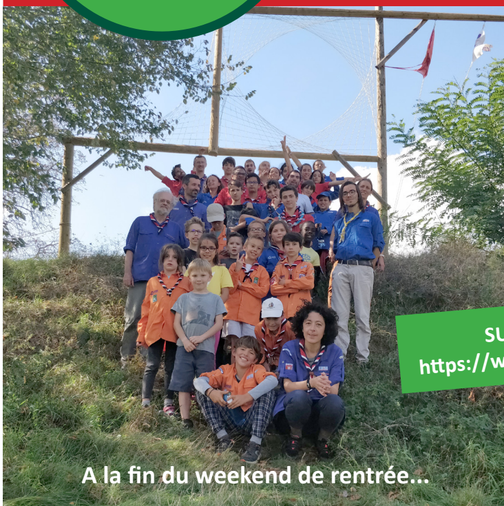
A la fin du weekend de rentrée...

le samedi 22 juin, c'est la Fête du groupe ! Enfants, jeunes, parents et amis sont invités !