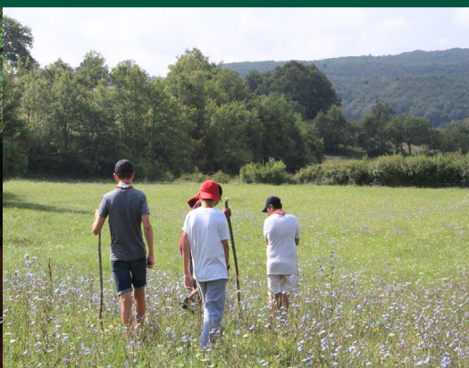
Bien marcher et marcher bien !