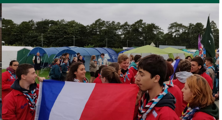
Jamboree international Red Rose près de Leeds