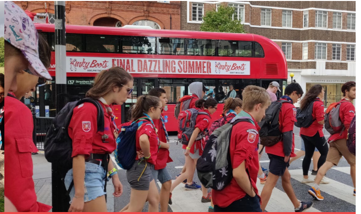
Randonnée à Londres

Ils ont été nos chefs et cheftaines, ils sont partis vers d'autres aventures. Merci à eux ! Et bonne route !