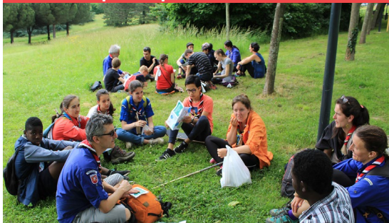
Tempête de cerveau pour trouver un slogan