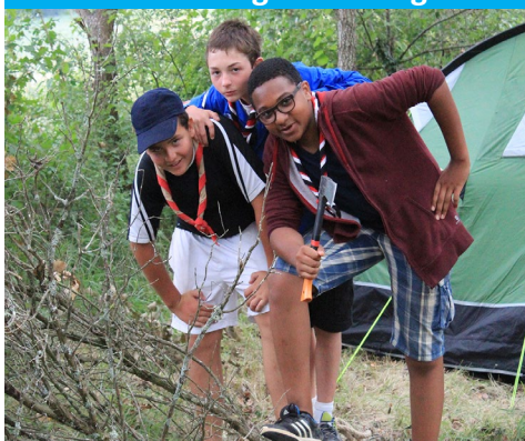
Le goût du travail bien fait !