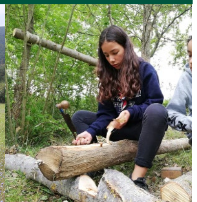
Travail du bois