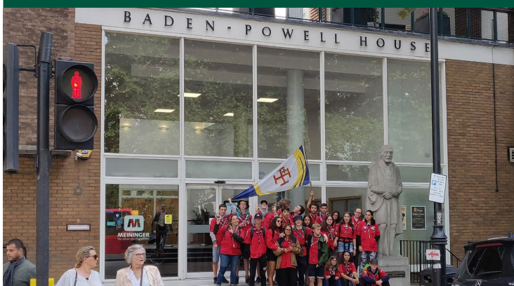
Devant l'emplacement de l'ancienne maison de Baden Powell, à Londres