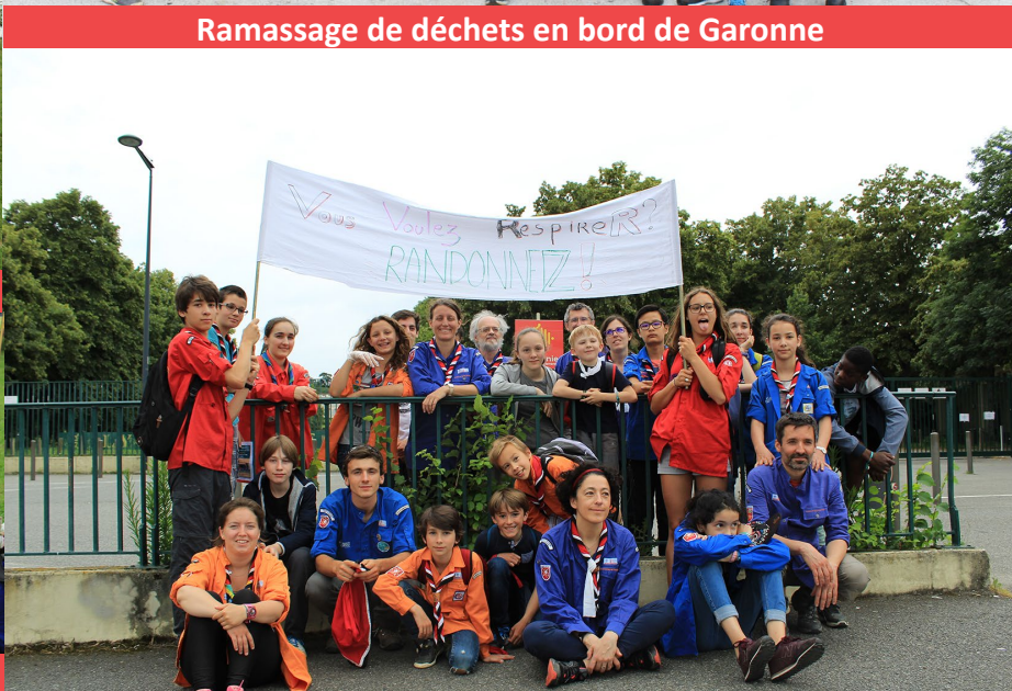
Fin de parcours à la station de Métro Paul Sabatier

Du 19 aout au 26 aout, à Cazeneuve Montaut (31) le camp Louveteaux - Jeannettes, avec la peuplade de Plaisance