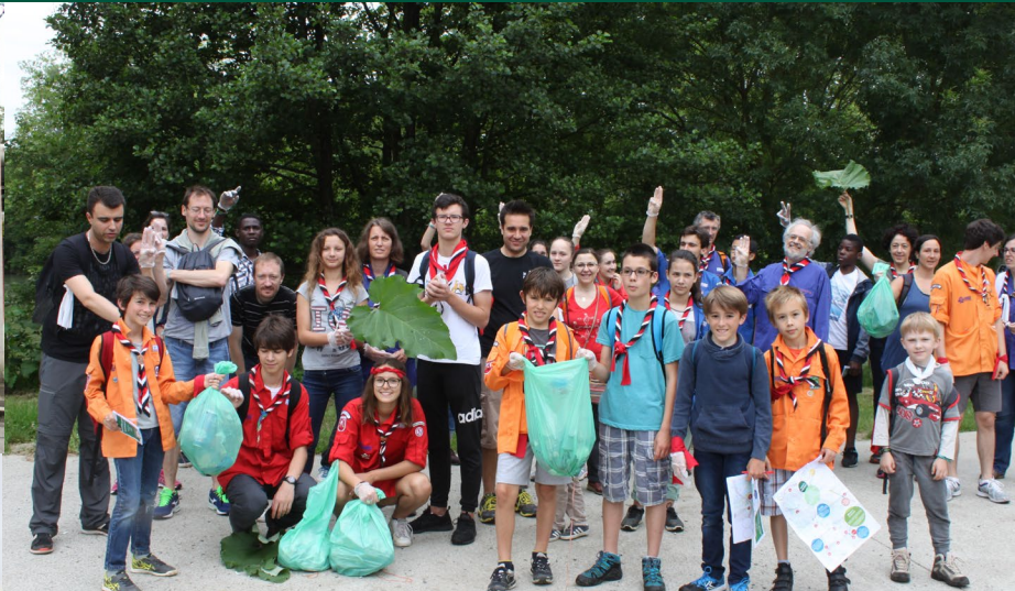
Ramassage de déchets en bord de Garonne