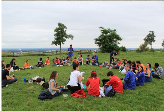
Pique nique à Pech David