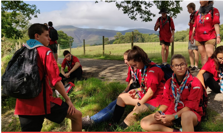
Randonnée dans la région de Keswick