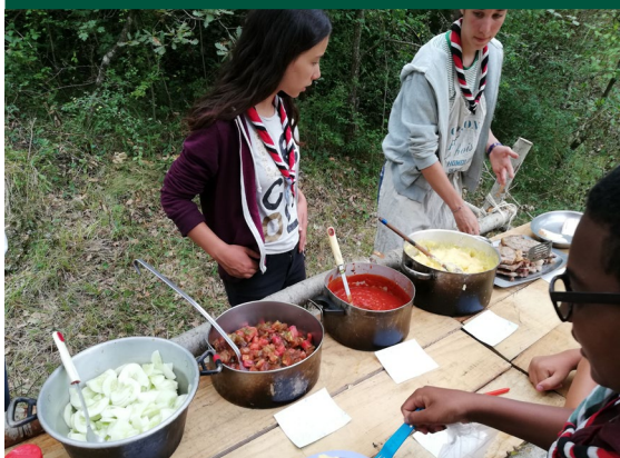
Bien manger et manger bien !