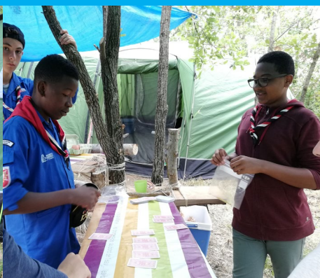
le jeu du «Village»... chacun son métier...