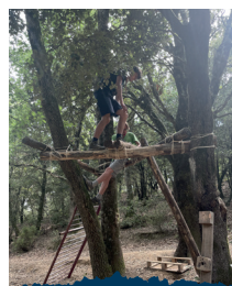
Les Chefs Pionniers - Caravelles