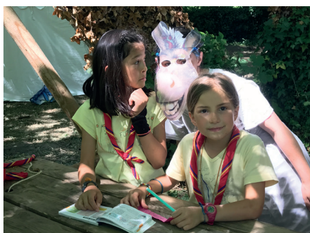
Les chefs Louveteaux Jeannettes.

La vaillante peuplade a réussi à retrouver Dragonne et le cadeau avant la fin de la semaine et ainsi fêter l'anniversaire de Fergucia, Farkle et Felicia au Grand Casino de Fort Fort Lointain.