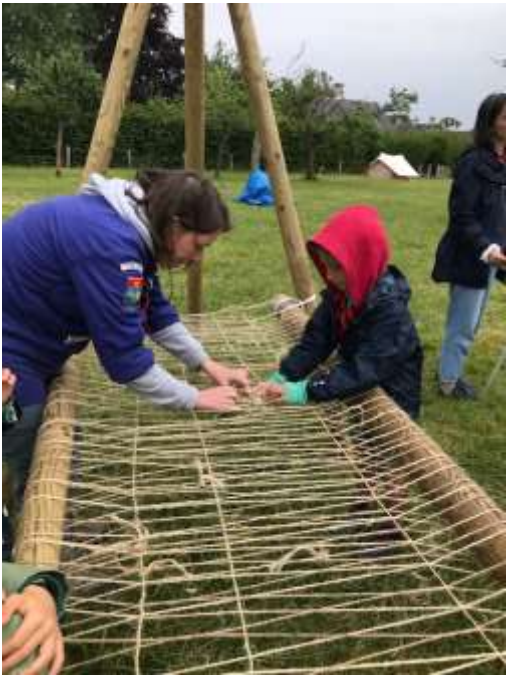
Chacun a mis la main à la pâte pour les installations !