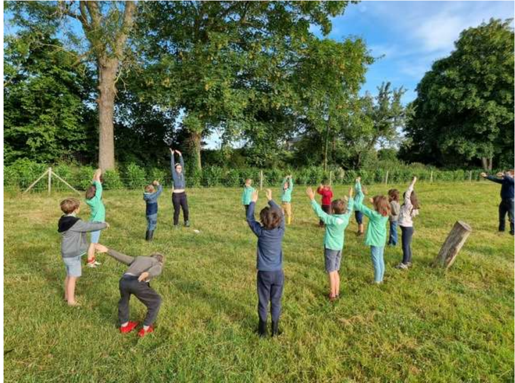
Quoi de neuf pour se réveiller qu'une petite séance de yoga ?