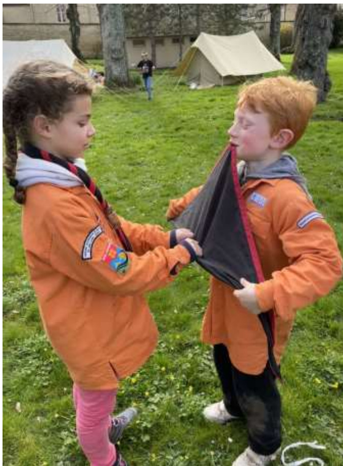
L'art et la manière de bien rouler son foulard !

Puis, les louveteaux sont partis à la chasse aux œufs !