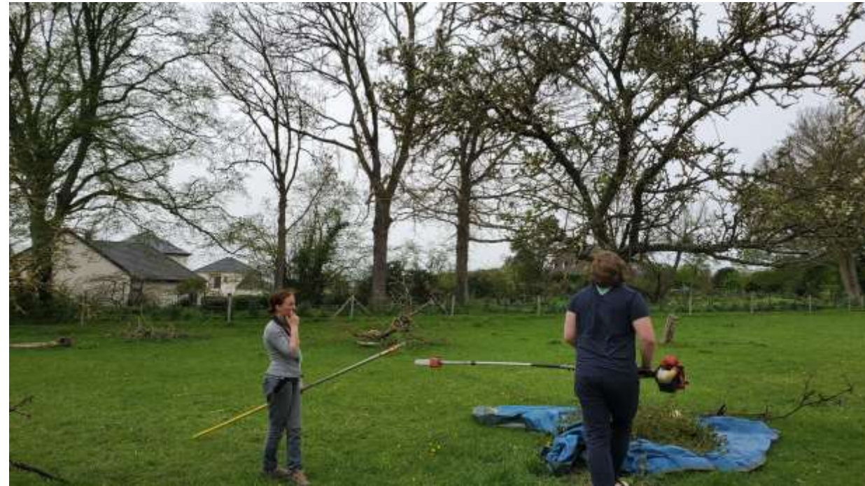
Extra-job « jardinage » en avril.

Un extra-job « baby-sitting » a été aussi effectué début mai lors d'un mariage au château de Caen.