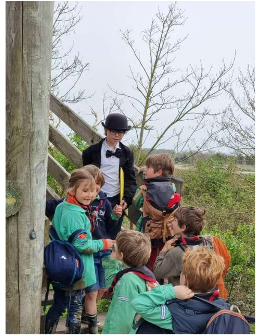
6 avril : Nos farfadets se sont rendus à Ouistreham pour un grand jeu organisé avec Dupont et Dupond !