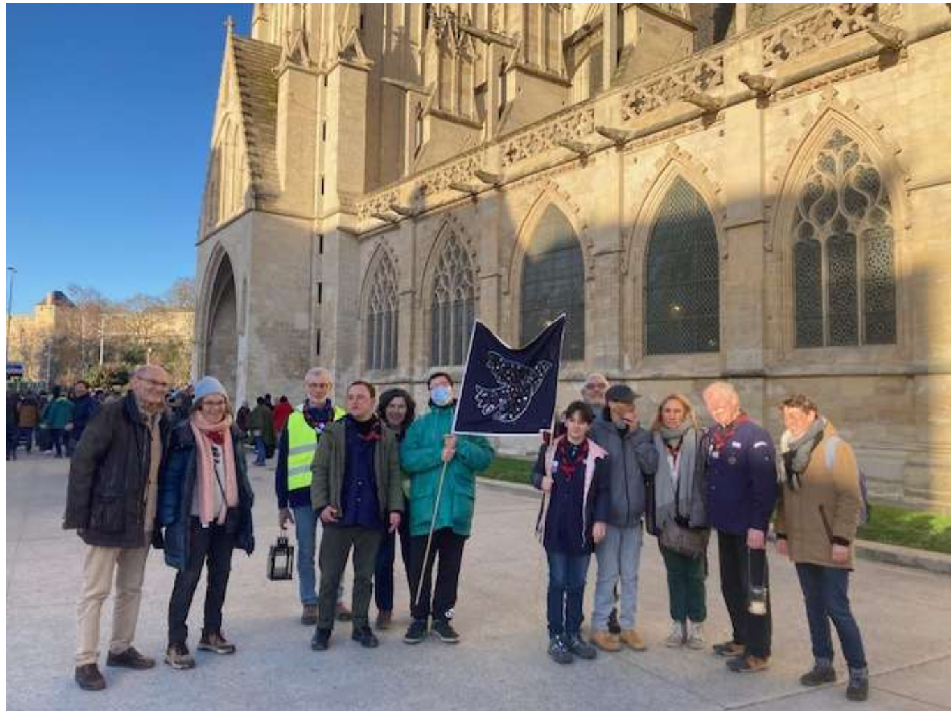
Le groupe des audacieux lors de la lumière de Bethléem