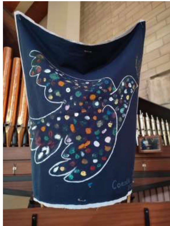
Colombe de la paix peinte par les audacieux (d'après Picasso)