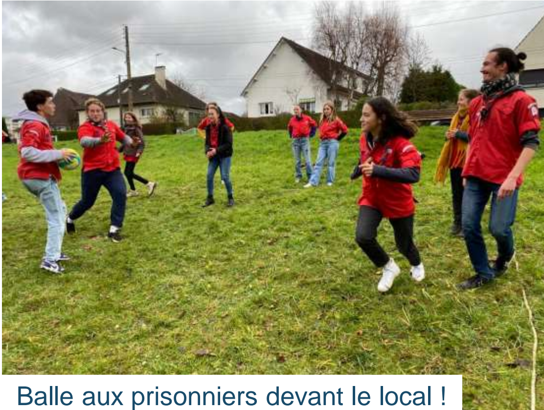
Balle aux prisonniers devant le local !