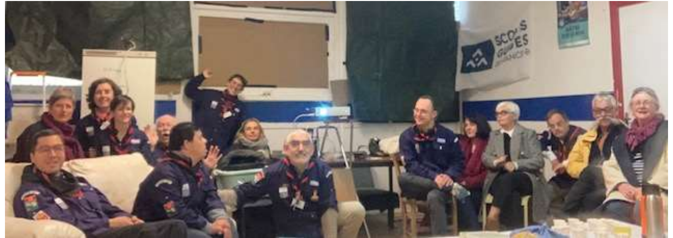
Photo de groupe lors de la réunion du 22 octobre.

Travail terminé : Les audacieux ont terminé de rénover l'armoire à leur couleur ! Bravo pour ce beaux travail !