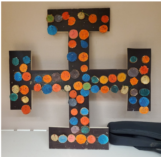
Croix fabriquée par le groupe d'Eu. Chaque rondelle représente un membre du groupe avec la couleur de sa chemise.