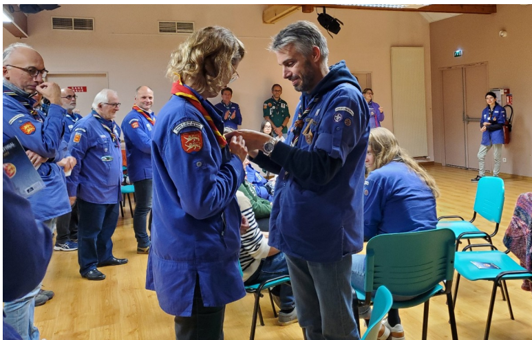
Mouvement de jeunesse et d'éducation populaire catholique ouvert à tous, sans distinction de nationalité, de culture, d'origine sociale ou de croyance. Association de loi 1901 reconnue d'utilité publique, habilitée à recevoir dons et legs.