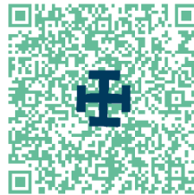
Projet éducatif des SGDF