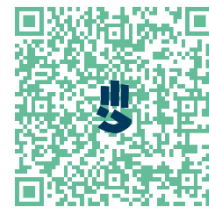
Loi des SGDF

Cette année, membres de l'équipe de groupe, chefs, cheftaines, jeunes et parents, nous nous attacherons à mieux comprendre et mieux vivre le second article l'article de notre loi :