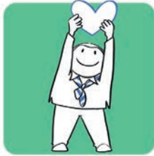
Grandir avec son cœur