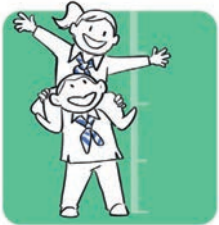
Grandir avec son corps

Un projet éducatif* autour de 6 axes qui structurent les actions du groupe et la progression de chacun.