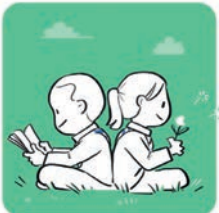
Grandir avec sagesse