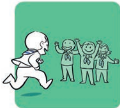
Grandir avec les autres