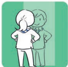
Grandir avec ses mains et sa tête