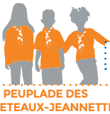
PEUPLADE DES LOUVETEAUX-JEANNETTES