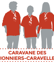
CARAVANE DES PIONNIERS-CARAVELLES