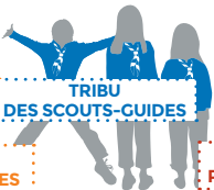
TRIBU DES SCOUTS-GUIDES