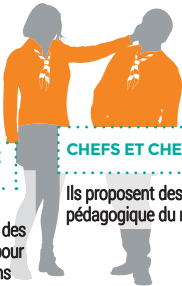
CHEFS ET CHEFTAINES

Sa mission est de coordonner l'ensemble des parents des farfadets pour organiser les animations de la ronde.