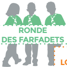
RONDE DES FARFADETS

Personnes ressources, ils proposent et accompagnent les temps de la vie spirituelle du groupe et le développement spirituel de chacun.