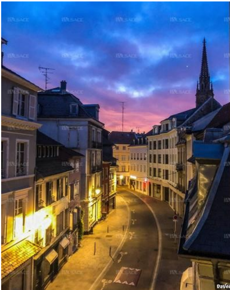
Rue des Tanneurs tôt un matin d'avril, pendant le confinement. DaVed Rue des Tanneurs tôt un matin d'avril, pendant le confinement. Photo L'Alsace /DaVed