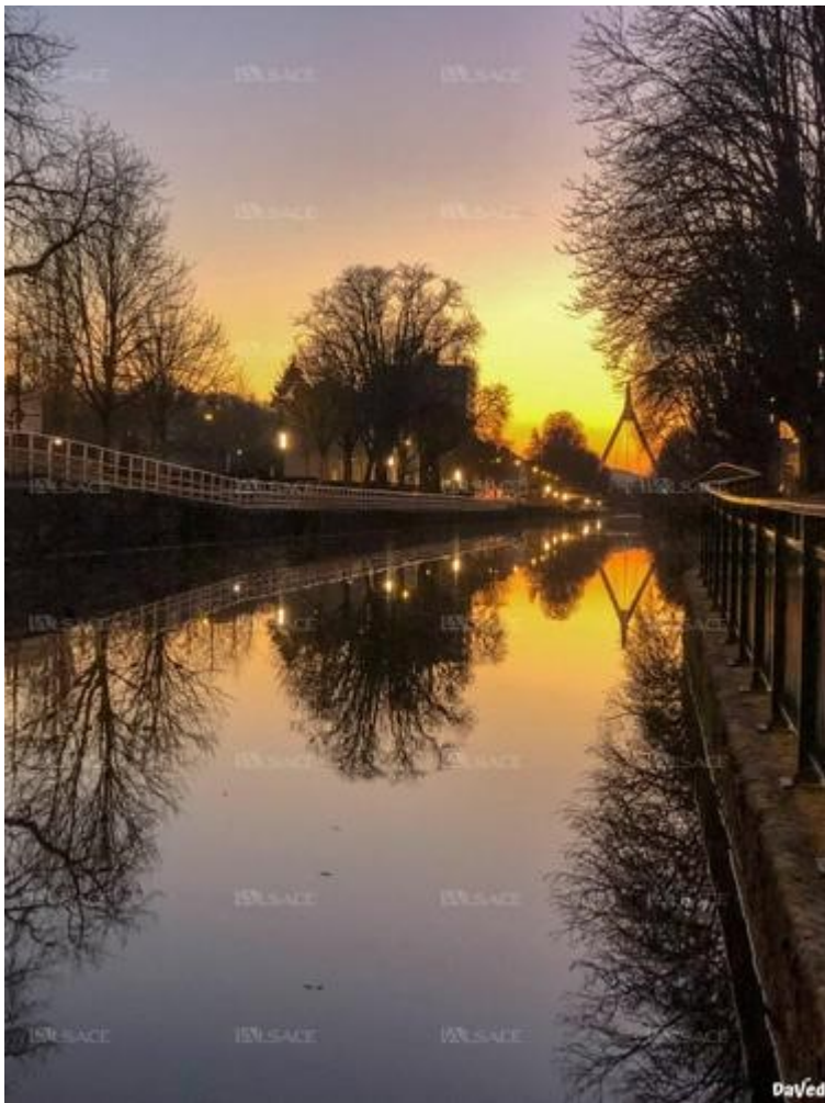
Quai d'Isly, février 2019.