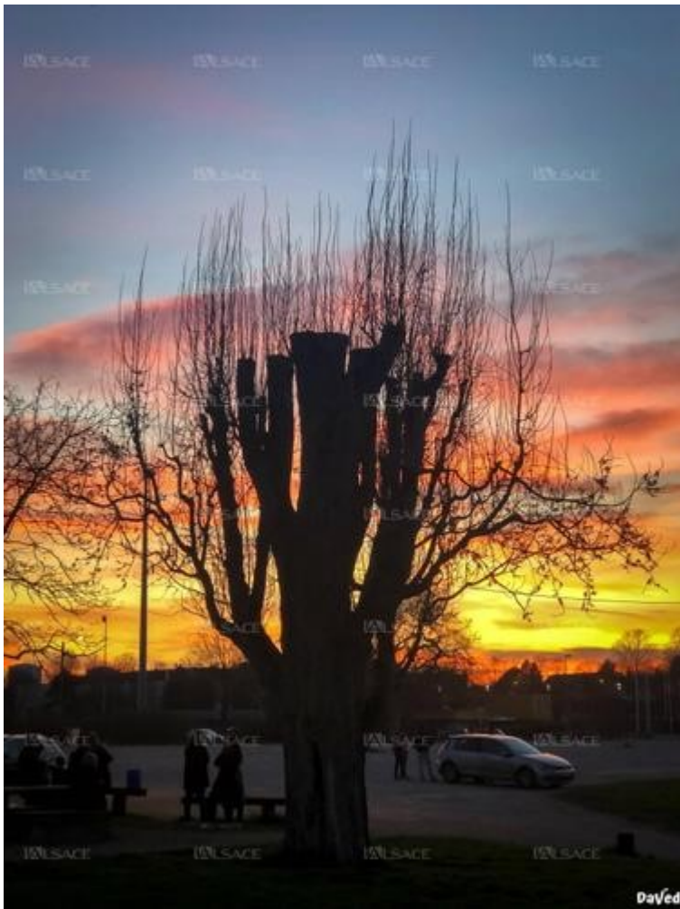
Mai 2020. "Tout arrêter, puis repartir... autrement !", écrit DaVed en légende de cette photo.