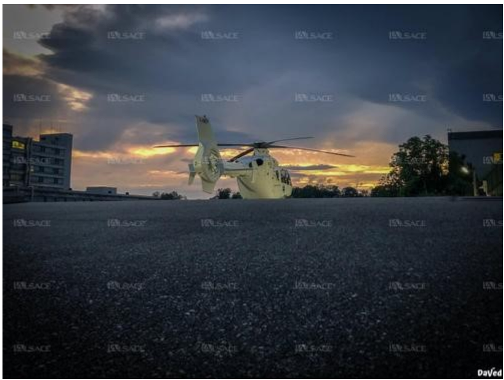
Sur le site du centre hospitalier Emile-Muller, mai 2020. "Le silence du moment ne nous permet pas d'oublier la ballet incessant des hélicoptères dans le ciel".