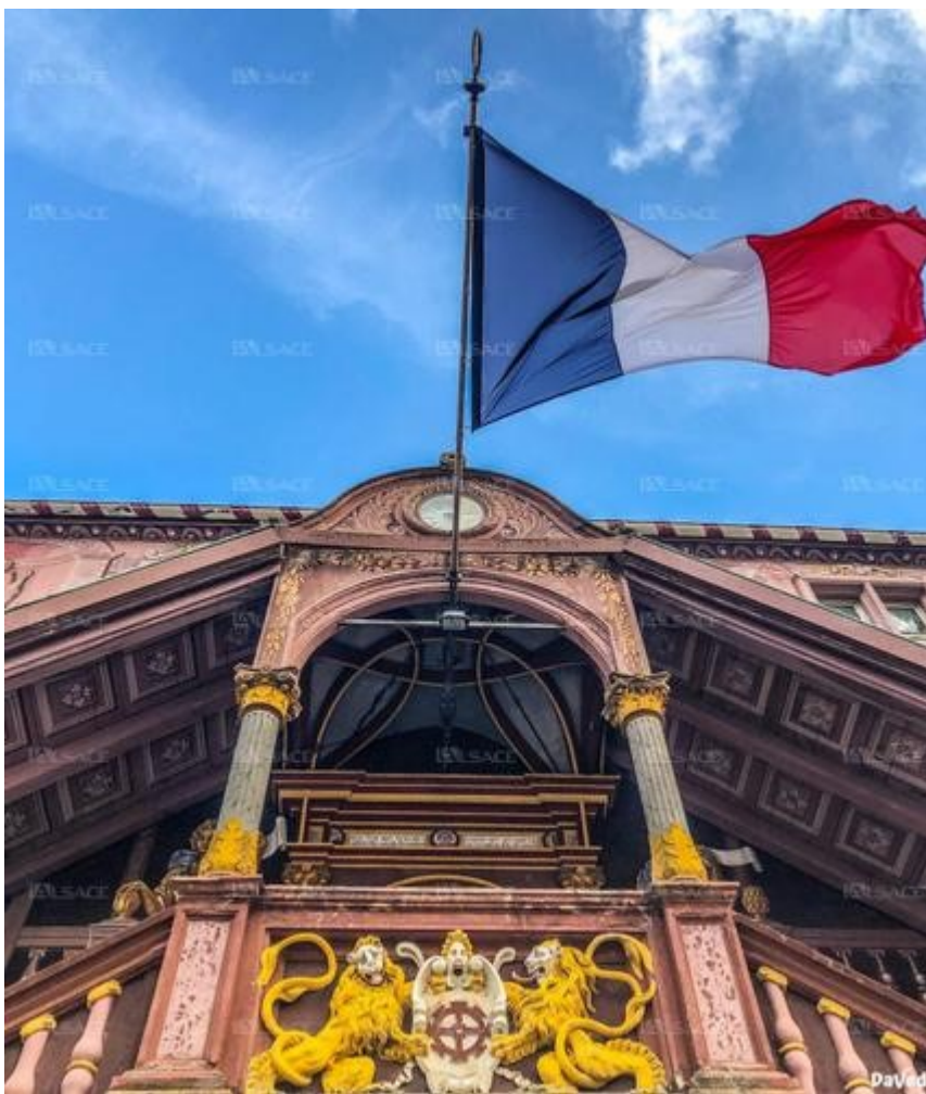
L'hôtel de ville, place de la Réunion, drapeau tricolore au vent.