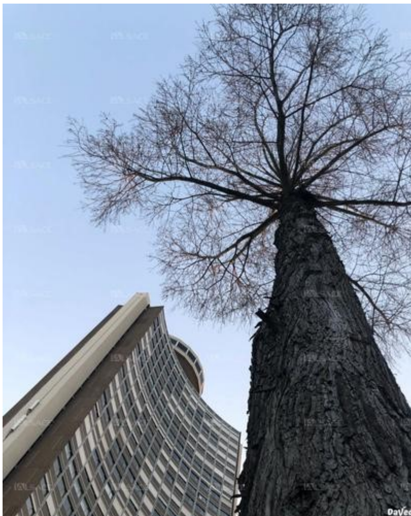
DaVed a intitulé cette photo «Ciel d'Europe». DaVed a intitulé cette photo "Ciel d'Europe".