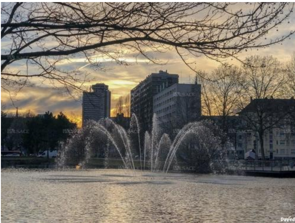
Le Nouveau Bassin, janvier 2019. Nouveau Bassin, janvier 2019.