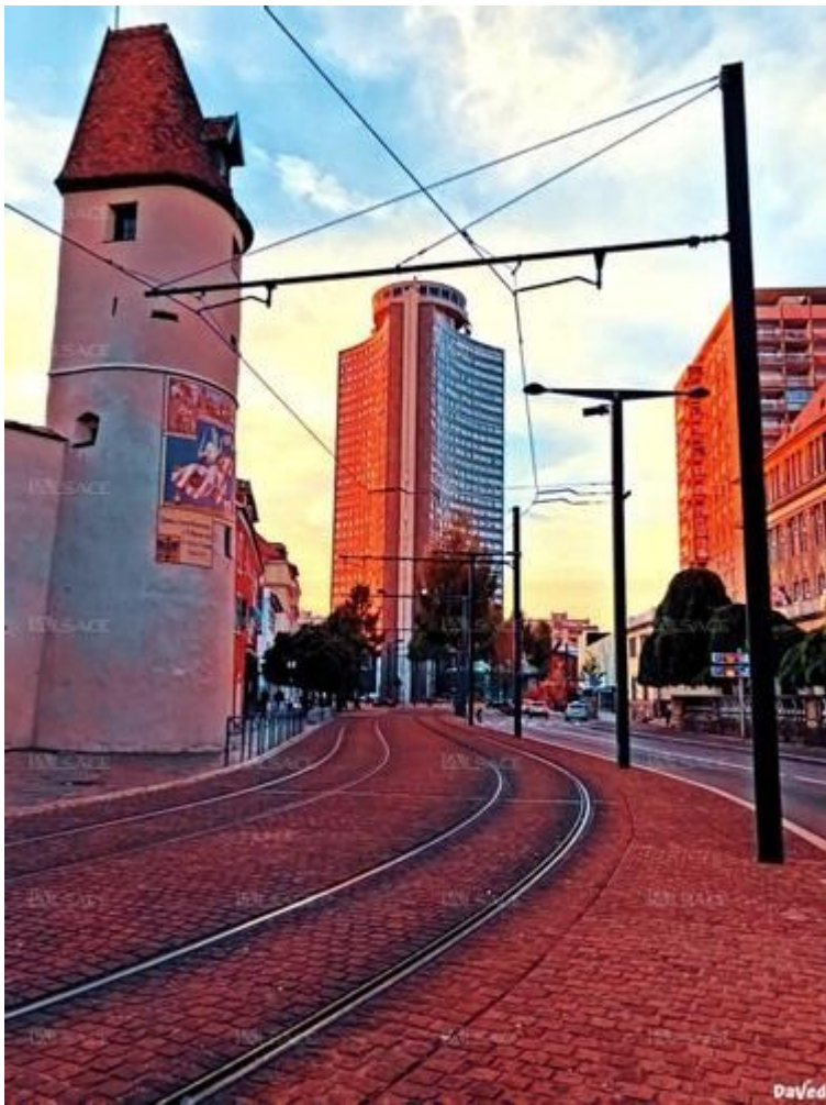
"Histoire de tours", décembre 2018.