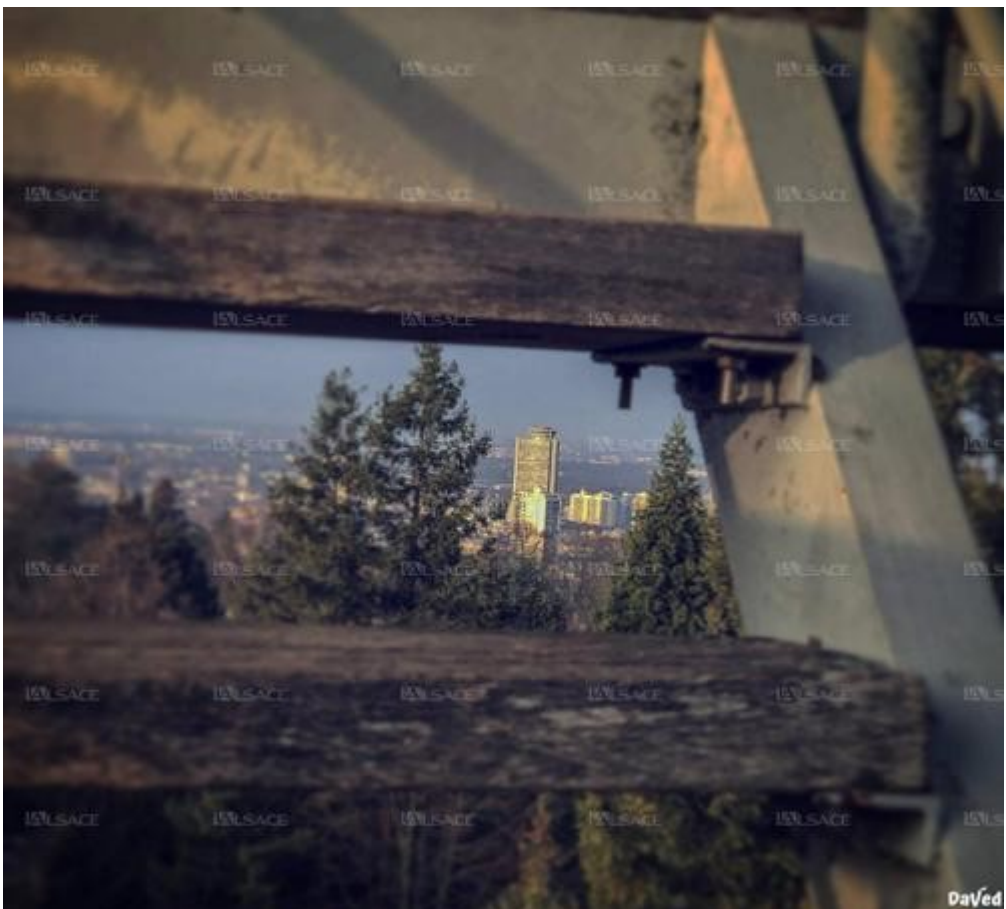
Entre deux marches du Belvédère, sur les hauteurs du Rebbberg. Janvier 2019.