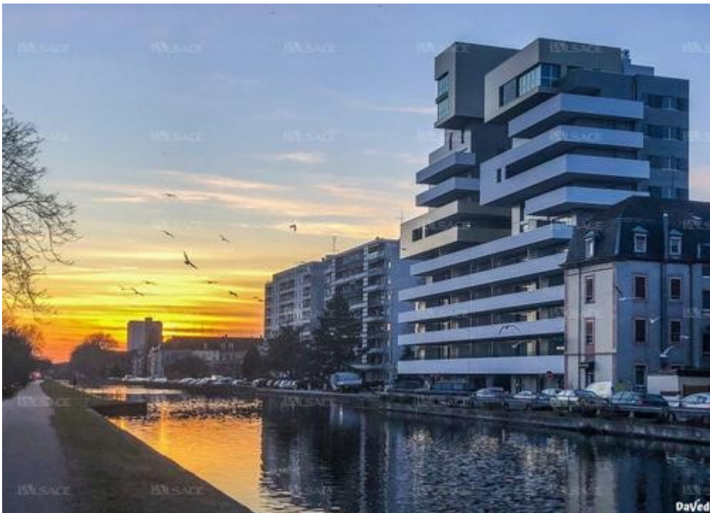
L'Almaleggo, quai d'Alma, au bord du canal: un "bâtiment totem" aux yeux de DaVed.