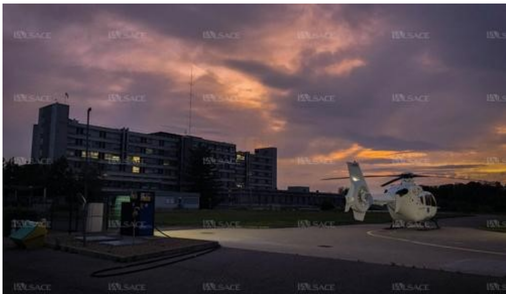
Sur le site du centre hospitalier Émile-Muller, mai 2020. «Le silence du moment ne nous permet pas d'oublier le ballet incessant des hélicoptères dans le ciel.» Sur le site du centre hospitalier Emile-Muller, mai 2020. "Le silence du moment ne nous permet pas d'oublier la ballet incessant des hélicoptères dans le ciel".