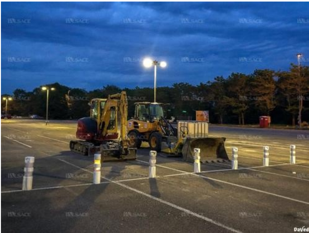
Une autre photo que DaVed a prise en mai sur le site de l'hôpital de Mulhouse après le départ de l'hôpital militaire qui avait été installé en renfort sur le parking au coeur de l'épidémie.